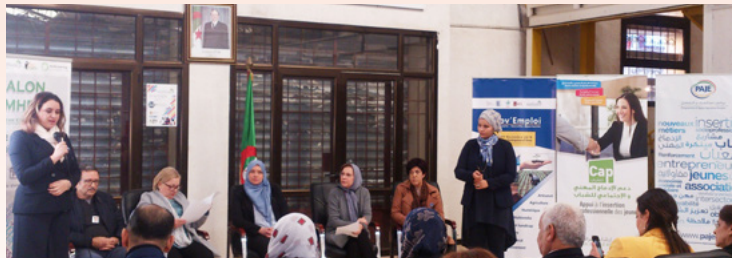
Table ronde - Pépinière d'entreprise d'Oran- 28 novembre 2018

Dans le cadre du projet "Innov'asso", qui a pour but le développement local et la valorisation du travail associatif, et en partenariat avec l'association IMC/Nour, l'association Flambeau Vert de l'Environnement et Batik International, le Grdr a organisé à Oran les 28 et 29 novembre 2018 un forum sur l'emploi associatif «Innov'Emploi». Cet événement a également eu pour but le partage des résultats du projet Innov'asso notamment la présentation du «référentiel des métiers associatifs».