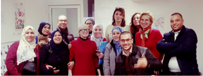
Personnel Cap jeunesse en immersion à Montpellier Mission locale antenne croix d'argent

Le PAJE a mis en œuvre un voyage d'étude à Montpellier au profit des personnels des plateformes Cap jeunesse Annaba, Béchar, Khenchela et Oran.