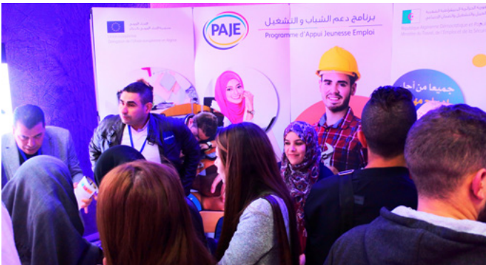
Stand Cap jeunesse - Université Badji Mokhtar - Annaba 8 novembre 2018