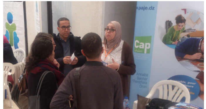
Stand Cap jeunesse - Pépinière d'entreprise d'Oran - 28 novembre 2018

• Participation active du PAJE à la caravane organisée par la Délégation de l'Union européenne (UE) en Algérie, en collaboration avec le projet EU Neighbours South et le projet Erasmus sous le thème « Entrepreneuriat et Industrie créatives »