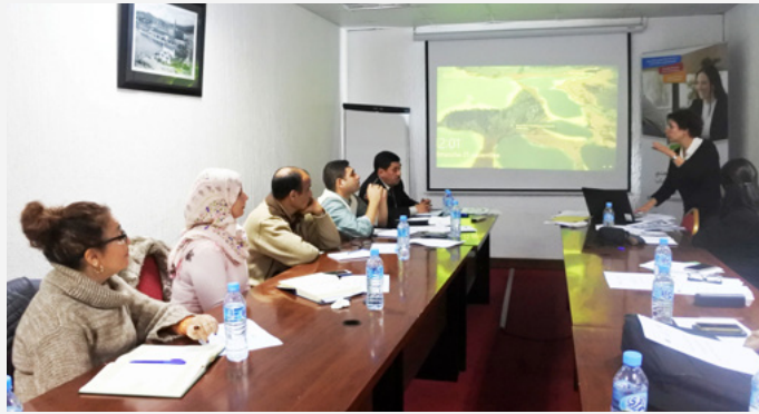
Formation accompagnement à la fonction observation dans les territoires pilotes – Hôtel "Rym El Djamil " Annaba – 25 novembre 2018

Elle vise notamment à permettre aux conseillers principaux observation auprès de la plateforme Cap jeunesse associés aux