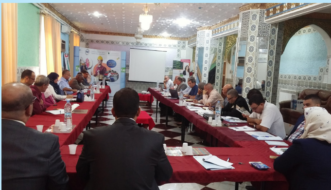
Réunion du comité technique local - Khenchela - 26 septembre 2018

La Direction locale du programme à Khenchela a organisé le 26 septembre 2018 une réunion avec les membres du comité technique de suivi local du PAJE dans la wilaya.