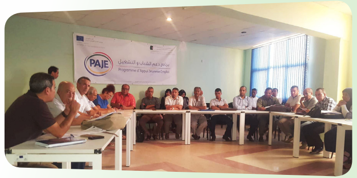
Ateliers de validation des contenus des formations en management associatif - Béchar - 17 septembre 2018

◦ Annaba, le 30 septembre et le 1 er octobre 2018. Pour rappel, le programme avait déjà organisé entre décembre 2017 et février 2018, dans chacune des wilayas pilotes, des missions de validation des acquis de ces stagiaires-formateurs sur les aspects liés à l'ingénierie pédagogique et l'ingénierie de formation.