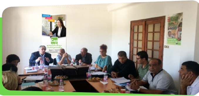
Réunion de briefing précédant le stage d'immersion avec le Directeur National du Programme – Siège de Sofreco/Alger – 7 octobre 2018