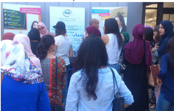
Stand Cap jeunesse - Université des sciences et de la technologie d'Oran - 15 octobre 2018

Participation du PAJE par un stand d'exposition à une journée organisée le 14 octobre 2018 par le club scientifique Archimède au niveau de la faculté de génie mécanique de l'Université des sciences et de la technologie d'Oran.