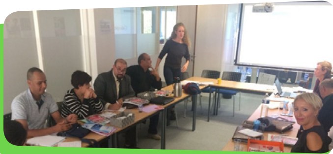
Stage d'immersion - Réunion d'accueil du groupe avec le Directeur Général de la Mission locale de Paris - 8 octobre 2018