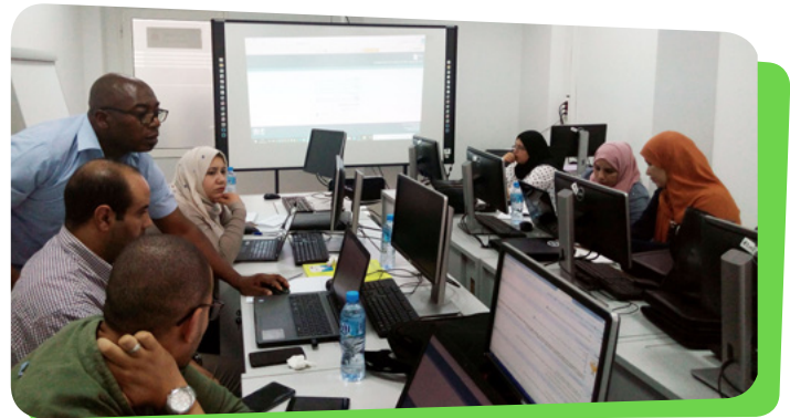
Formation « Gestion de la documentation » - Centre de formation ANEM - Douéra - 15 octobre 2018

Pour rappel, le PAJE avait déjà mis en œuvre, en octobre 2017, une formation aux techniques de documentation.